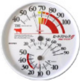
写真5 ヒートストレスメーター

暑熱ストレスは温度と湿度から算出される温湿度指数(THI)で判断できます。牛舎に温湿度計やヒートストレスメーター(写真5)を設置して暑熱ストレスを確認しましょう。