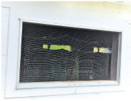
写真2 ネットを取り付けた窓

トンネル換気では、風速によって換気扇の設置台数が変わります。壁の換気扇を増設するか(写真3)、通路に送風機を置いて換気量を増やしましょう。その際の入気口の大きさや位置は普及センターにお問合せください。