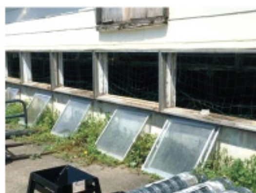
写真1 窓を取り外した牛舎

その場合、西日が差し込む窓にすだれや寒冷紗を付ければ、牛舎内の気温上昇を抑えることができます。