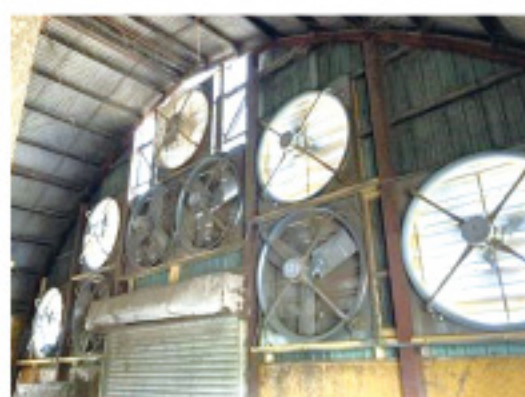
写真3 壁の換気扇の増設

トンネル換気では、風速によって換気扇の設置台数が変わります。壁の換気扇を増設するか(写真3)、通路に送風機を置いて換気量を増やしましょう。その際の入気口の大きさや位置は普及センターにお問合せください。