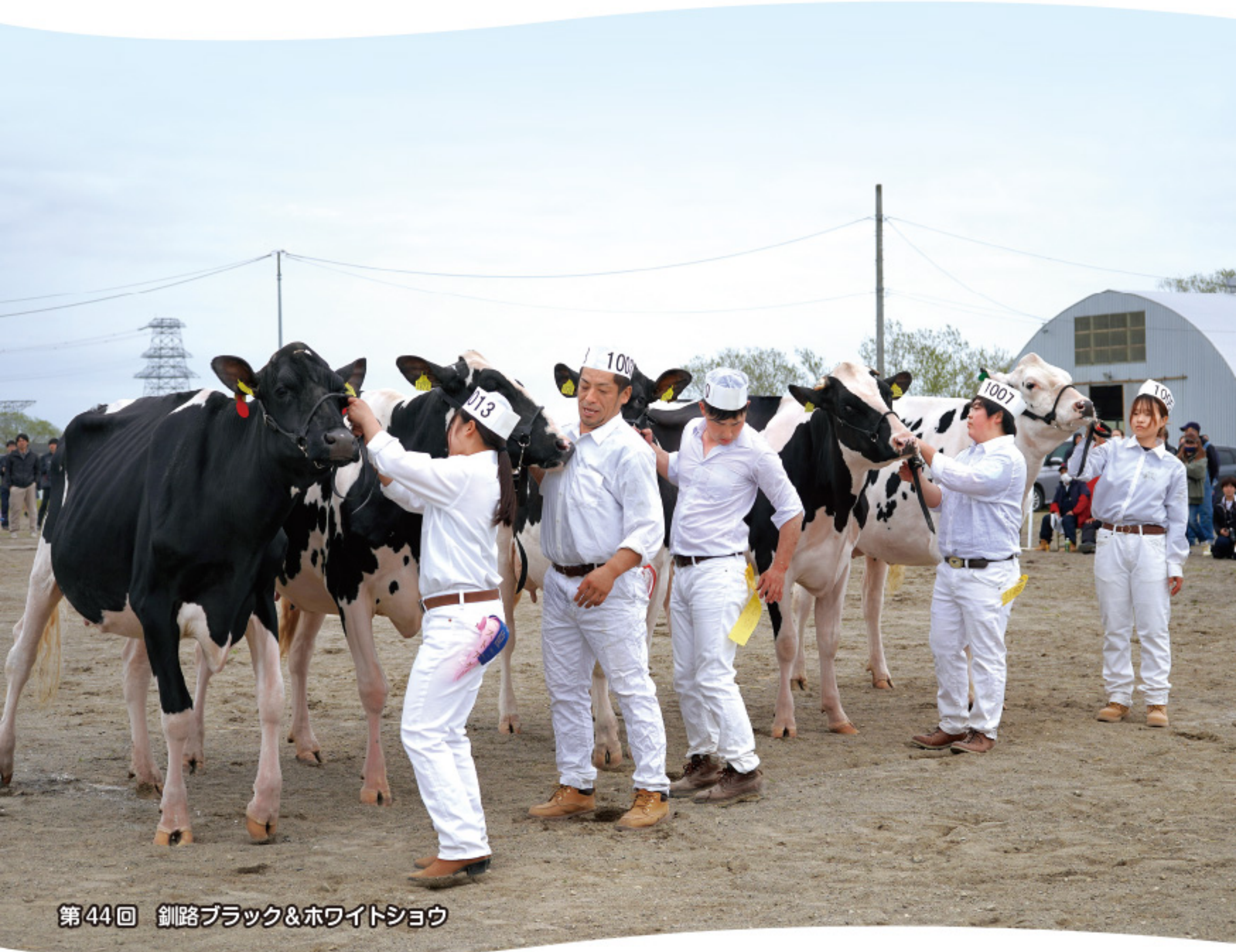
第44回 釧路ブラック&ホワイトショウ