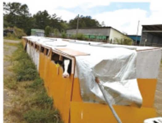
写真4 後側に開口部があり遮熱シートをかけたカーフハッチ

子牛は、気温が25℃を超えると暑熱の影響を受けます。特に屋外のカーフハッチは注意しましょう。後ろ側にも開口部のあるものが望ましいです。前に扇風機を置く、遮熱シートで熱を遮断するなどの対策を取りましょう(写真4)。