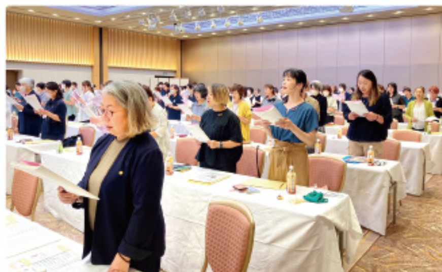
女性組織5原則唱和の様子