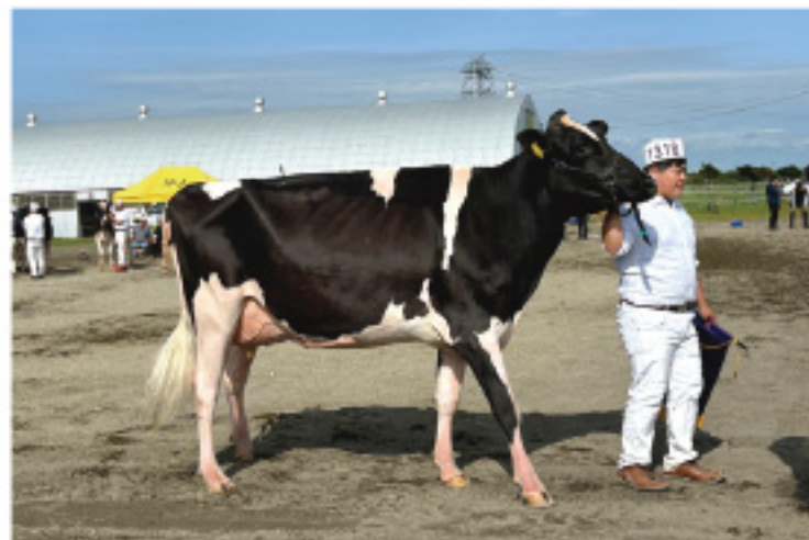
グランドチャンピオンを受賞した スターリスカイ プラネット サイドキック