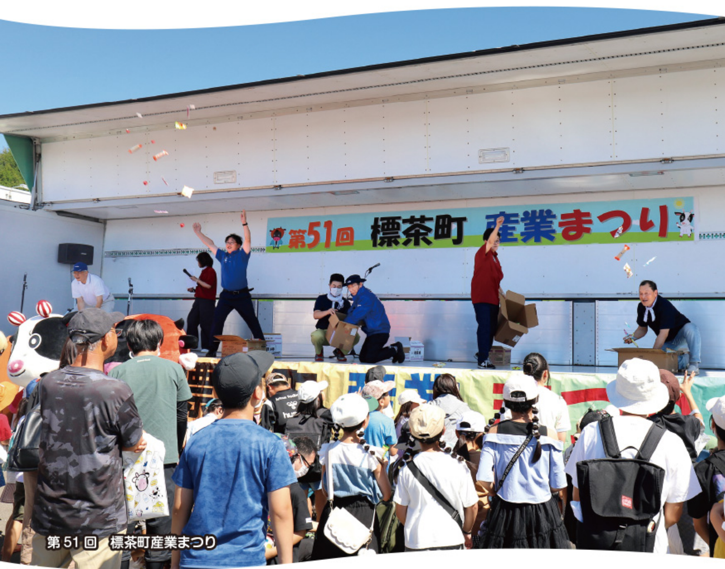
第51回 標茶町産業まつり